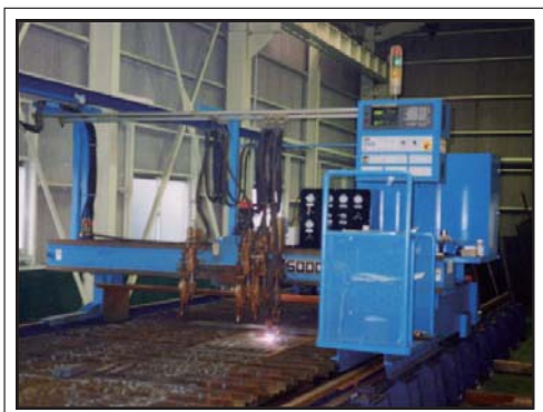
ネ스팅加工 材料の板取りは、CAD図に基づいて、NC自動切断機の作業に連動しています。